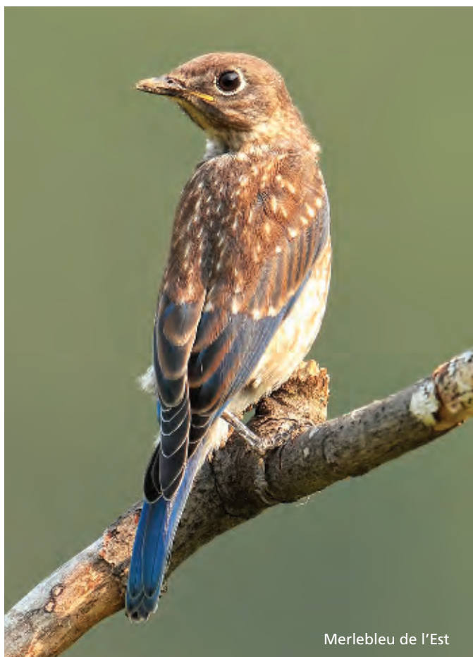
Merlebleu de l'Est