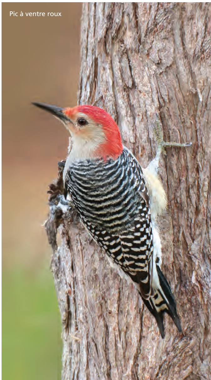
Pic à ventre roux

roux. De l'autre côté de la route 202, le sentier s'étire jusqu'à la 34 e Rue Ouest et permet de découvrir des habitats protégés par Conservation de la nature Canada : une tourbière, une prucheraie et une pinède où la Paruline des pins est bien présente. Au fait, plus d'une vingtaine d'espèces de parulines peuvent être observées sur l'ensemble du territoire, dont plusieurs nicheuses.