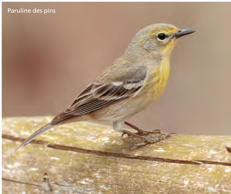
Paruline des pins

La protection du territoire et l'aménagement du sentier ont mobilisé plusieurs autres intervenants, dont la municipalité de Venise-en-Québec, la Société d'initiative touristique et économique du lac Champlain, la Fondation Hydro-Québec pour l'environnement, Conservation de la nature Canada et les propriétaires fonciers engagés dans la protection des lieux.